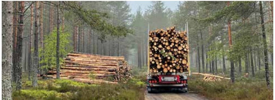
Skogens komplexa logistikflöden är ett av ämnena som berörs på F&T-konferensen

Den 8–9 oktober bjuder Plan in till den tjugotredje forsknings- och tillämpningskonferensen, som i år gästar Linnéuniversitetet i Växjö. Som vanligt fokuserar programmet på vad som händer vid logistikens forskningsfront – med tydlig praktisk nytta.