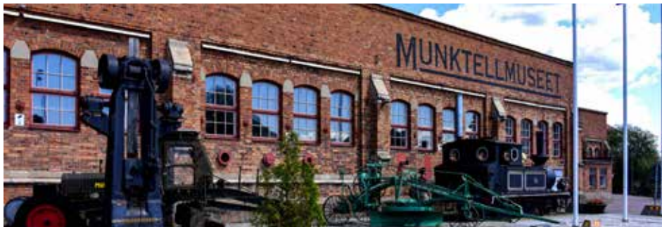
Årets konferensmiddag hålls på Munkteilmuseet