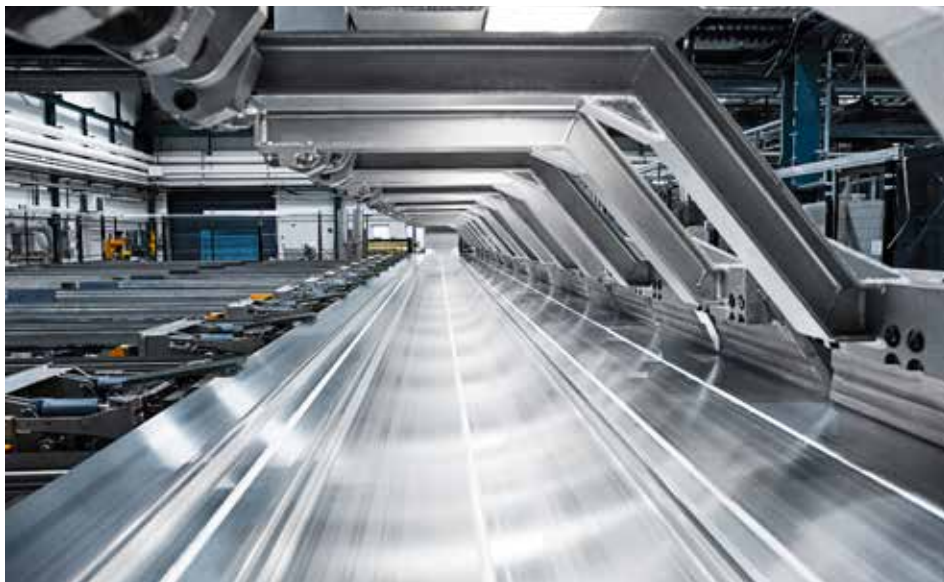
Hydro Sverige har två anläggningar i Vetlanda och Finspång, med extrudering av aluminiumprofiler, bearbetning, ytbehandling och smältverksamhet.

– Vi får en hel del förfrågningar om företagsinterna kurser, särskilt inom produktionslogistik och lagerstyrning, konstaterar Axel Ågren på Plans kansli.