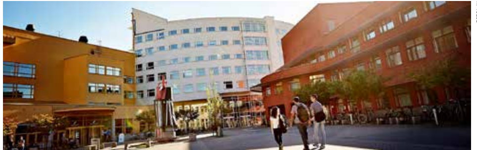
Plan-konferensen 2023 hålls den 25-26 april på Jönköpings universitet.

centrallager i Torsvik, Jönköpings kombiterminal, DFDS nya TPL-lager och Husqvarnas globala reservdelslager på Södra Stigamo och på Nobias nya, 123 000 kvm stora, högautomatiserade Marbodal-köksfabrik.