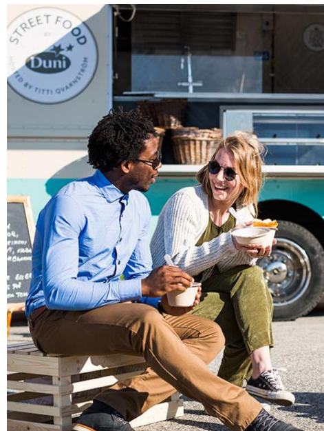
Duni - Industri 4.0