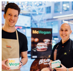
Anamma - från Eslöv till McD