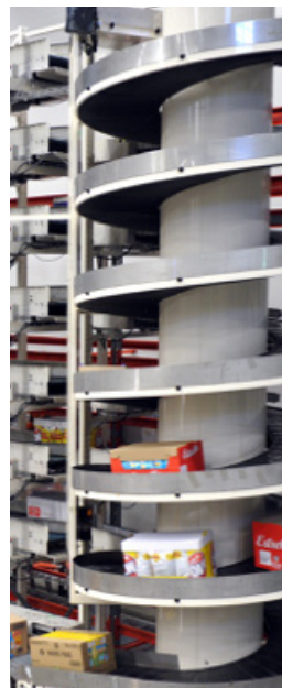
Automation hos ICA