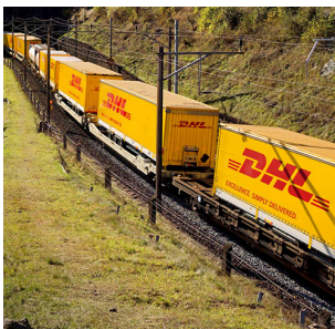
Silk Road - tåg från Kina