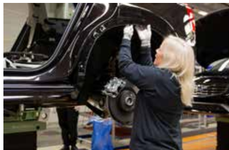
Biltillverkning sker "just in time", kundunika komponenter levereras i sekvenserade transporter från leverantörerna.

– Förändring handlar i grunden om människor. Att få alla att förstå varför förändringen sker och sedan jobba mot samma mål. Det är den största utmaningen.