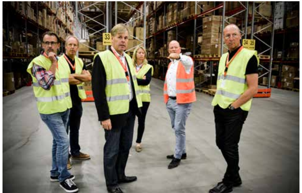
Ett litet, initierat gäng deltog i Plans nätverksträff på Aditros lager i Borås i augusti.

Aditro har på senare tid breddat verksamheten från ren TPL-verksamhet